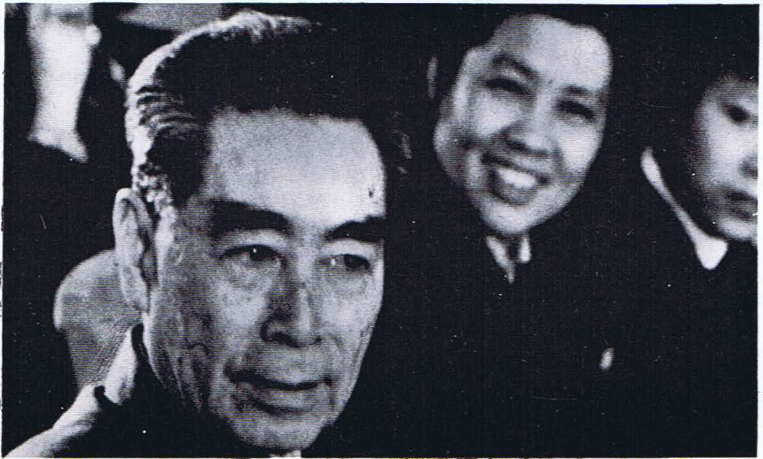
Tschu En-lai, Ministerpräsident der Chinesischen Volksrepublik (zu: Maos Revolution von oben, S. 145)